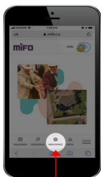
SUR APPAREIL MOBILE