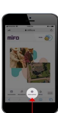
SUR APPAREIL MOBILE